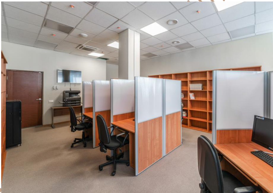
Библиотека и читальный зал