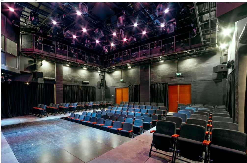
Учебный театр оснащен

техническим телевидением с трансляцией в студии звукозаписи и звукового монтажа.